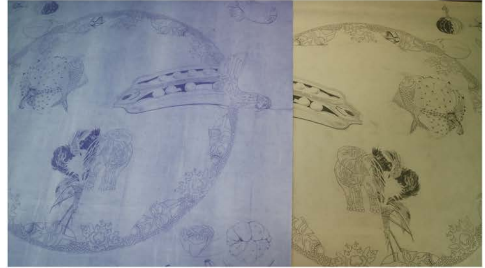
drawing and cyanotype